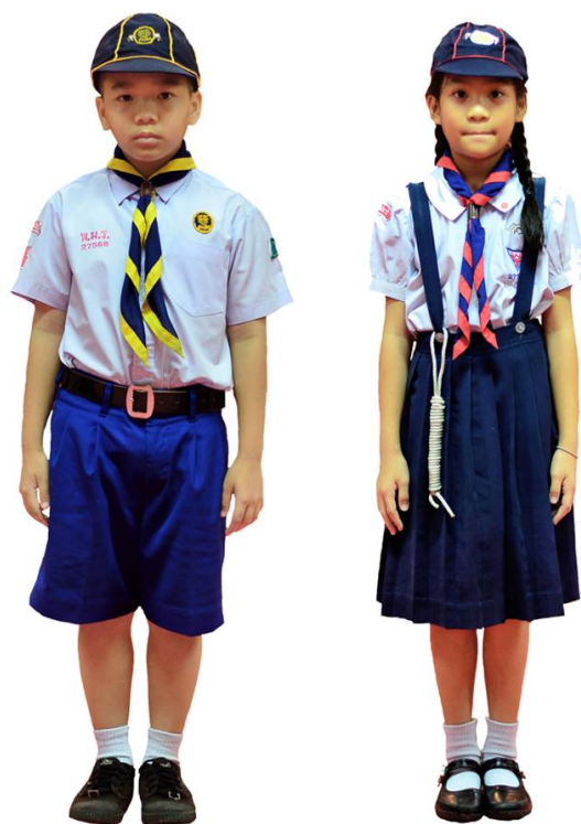
เครื่องแบบลูกเสือ - เนตรนารีสำรวจ