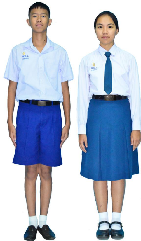
เครื่องแบบนักเรียนระดับชั้นมัธยมศึกษาตอนปลาย