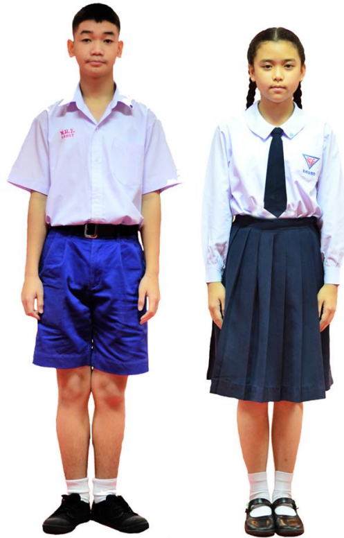
เครื่องแบบนักเรียนระดับชั้นประถมศึกษาปีที่ 5 - 6 และระดับชั้นมัธยมศึกษาตอนต้น