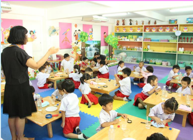
หนูน้อยนักวิทย์