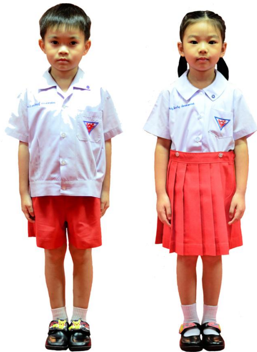
เครื่องแบบนักเรียนระดับชั้นอนุบาล