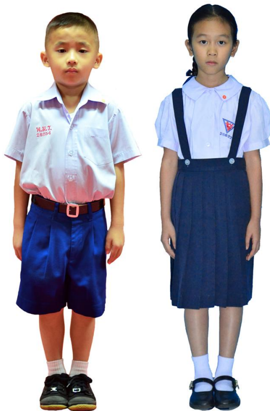
เครื่องแบบนักเรียนระดับชั้นประถมศึกษาปีที่ 1 - 4