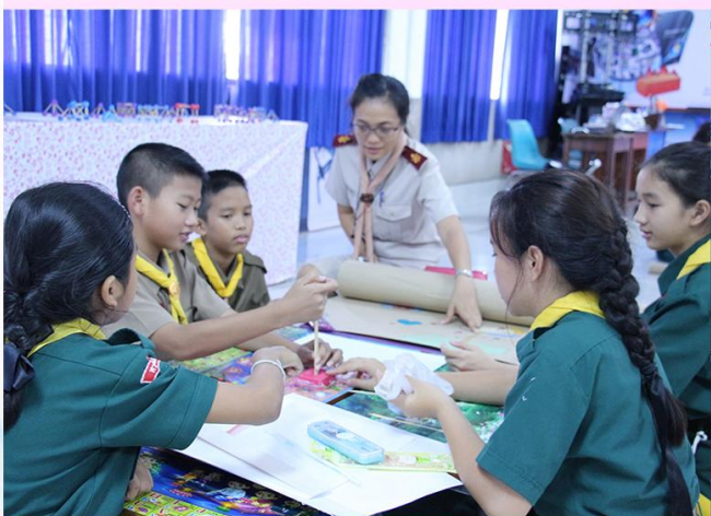
สะเต็มศึกษา (มัธยมต้น)