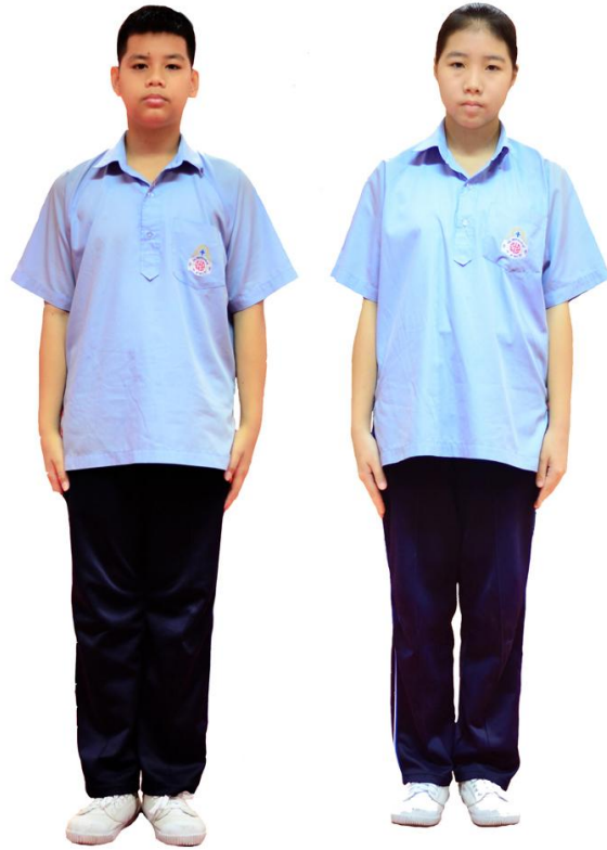
เครื่องแบบพลศึกษา ระดับชั้นมัธยมศึกษาตอนต้น