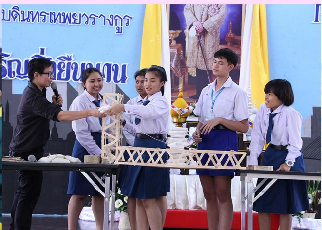
สะเต็มศึกษา (มัธยมปลาย)