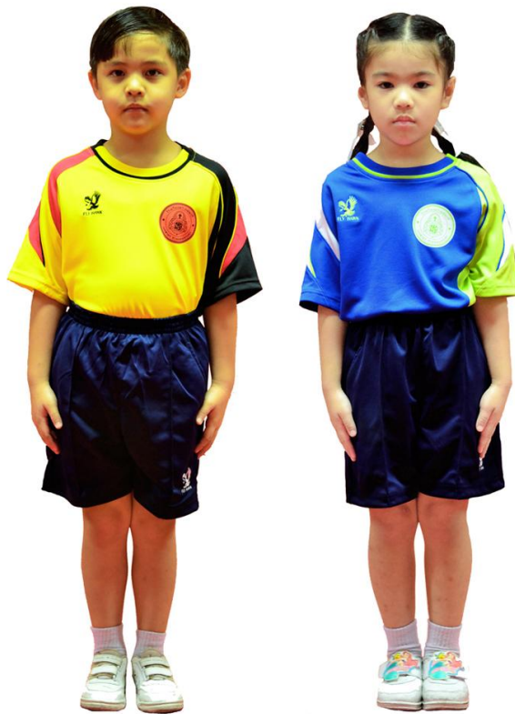
เครื่องแบบพลศึกษาระดับชั้นอนุบาล