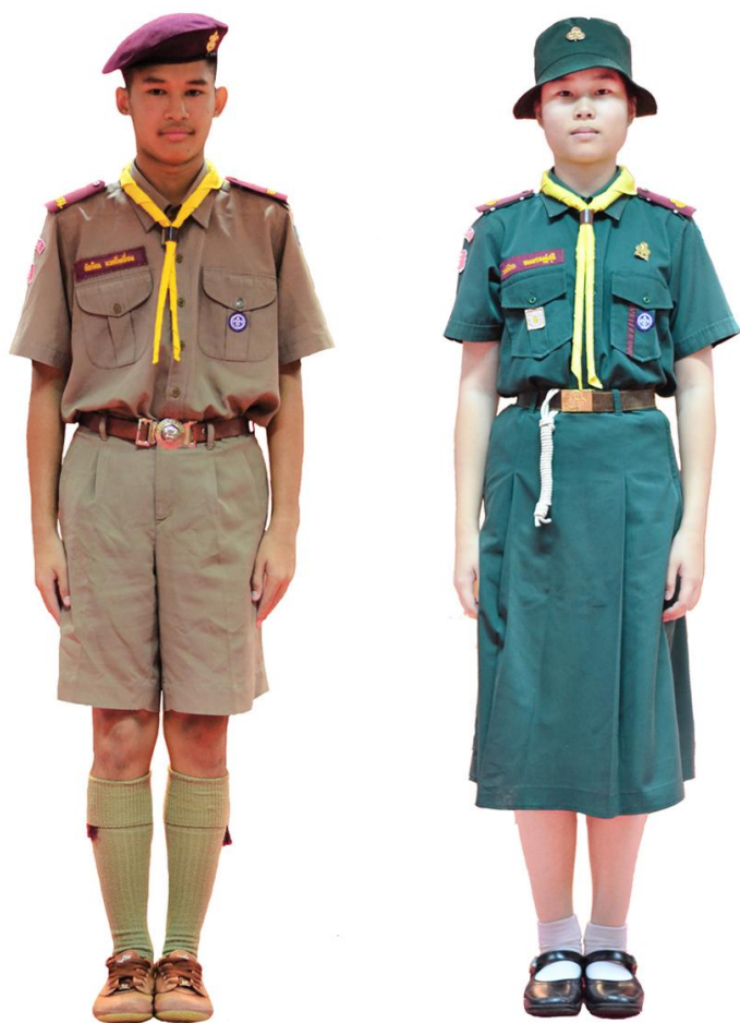
เครื่องแบบลูกเสือ - เนตรนารีสามัญรุ่นใหญ่