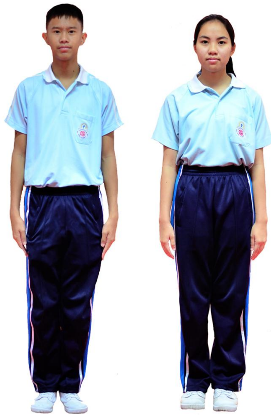
เครื่องแบบพลศึกษา ระดับชั้นมัธยมศึกษาตอนปลาย