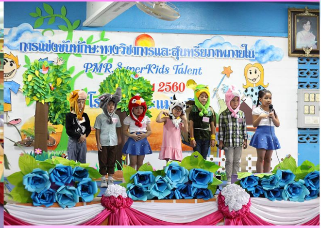
เวทีคนเก่ง