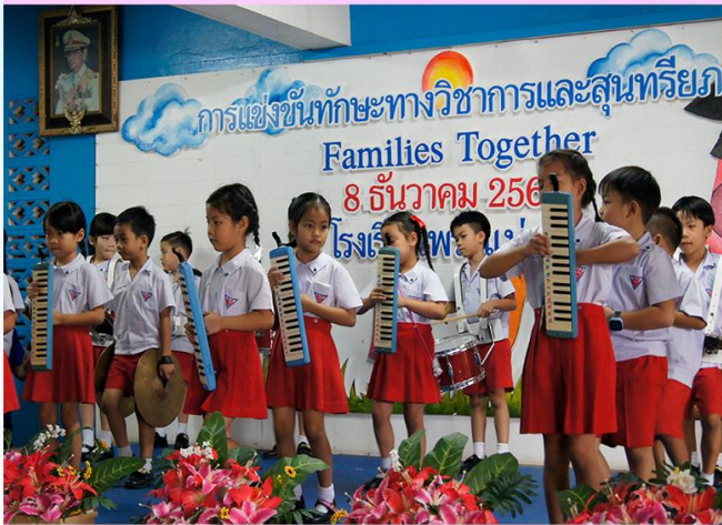
วงเมโลเดียน