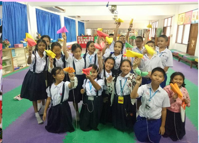
สะเต็มศึกษา (ประถม)