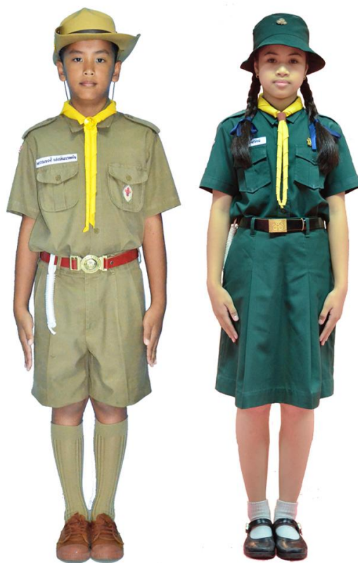
เครื่องแบบลูกเสือ - เนตรนารีสามัญ