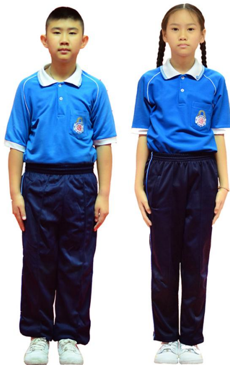
เครื่องแบบพลศึกษาระดับชั้นประถมศึกษา